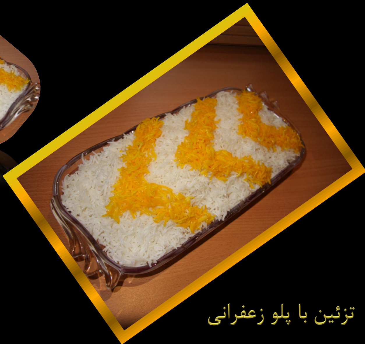
تزئین با پلو زعفرانی